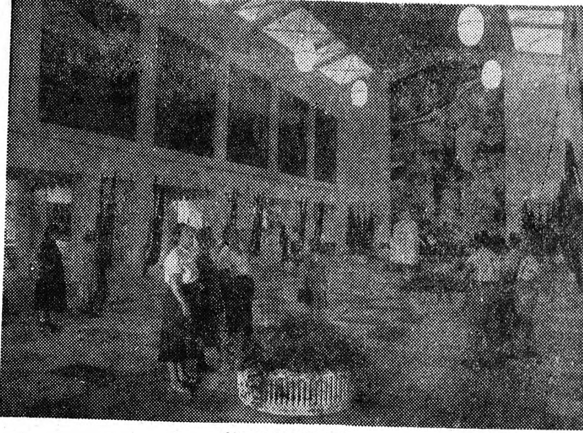
Séta a főpavilonban

Eddig csaknem 500 külföldi fordult meg az Országos Mezőgazdasági Kiállításnál. Legtöbbször — 118 látogató — a Szovjetunióból jöttek, de sok vendége volt a kiállításnak a népi demokratikus országokból is. Szintén szép számmal keresték fel a kiállítást a nyugati országokból. A hét folyamán még sok külföldi látogatót várnak.