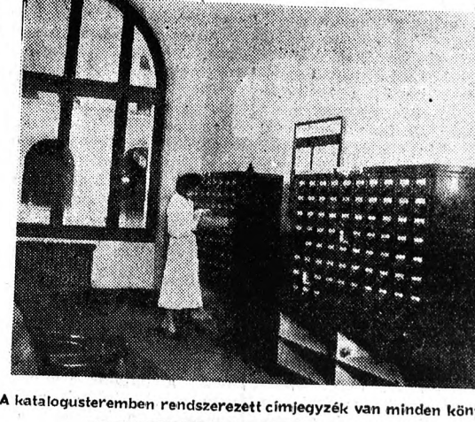
A katalogustermében rendszerezett címjegyzék van minden könyvről

A könyvtár legszebb része a hatalmas olvasóterem. A nap minden szakában szinte tömörre feszül itt a csend a szépen ívelő hajlatok és boltzatok alatt. Naponta százak és százak ülnek körül a kényelmes olvasóasztalok és kutatják a könyvek titkait az új nemzedék Faust konokságával.