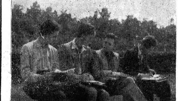
Egyetemi hallgatók tanulnak a parkban

Az egyetem előtt vidám és élénk élet folyik. A kőmedence előtt három fiatal lány áll, kék, fehér, szőlő ruhájukat lobogtatja a szél. Az egyik világoskék ruhában van, hosszú barna