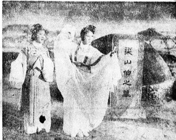
Jelenet a Pillangó meséje című filmből

Ugyancsak rövidesen bemutatásra kerül egy újszerű színes kínai mesefilm, a Pillangó meséje címen. A film ezer ével előtti, csodálatos mesevilág színpompás alakjait eleveníti meg, beleszóve egy bűbajos szerelemnek a történetét. A Fiú és a Pillangó meséje című filmek a Béke filmszínházban kerülnek bemutatásra. Az ünnepi vacsora a Vig filmszínház szeptember 20-tól vetíti.