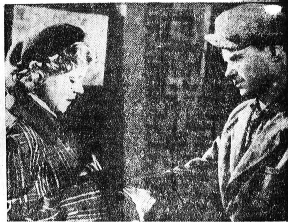
Jelenet a Fiú című filmből

A debreceni filmszínházak az őszi hónapokban új és művészi filmeket hoznak forgalomba. A nyári évadhoz hasonlóan a legkiválóbb magyar, szovjet és különböző európai filmalkotások kerülnek a közönség elé, melyek mindegyike nagy érdeklődésre tarthatnak számot. A közelebbi bemutatásra kerülő filmek közül is kiemelkedik az Ünnepi vacsora című új magyar film, melyben a legismertebb magyar filmszínészeket láthatjuk. Az ünnepi vacsorával egyidőben kerül bemutatásra a Fiú című színes szovjet film, amely a fiataloknak nyújt nagy segítséget az élet új és új problémáinak megoldásában.