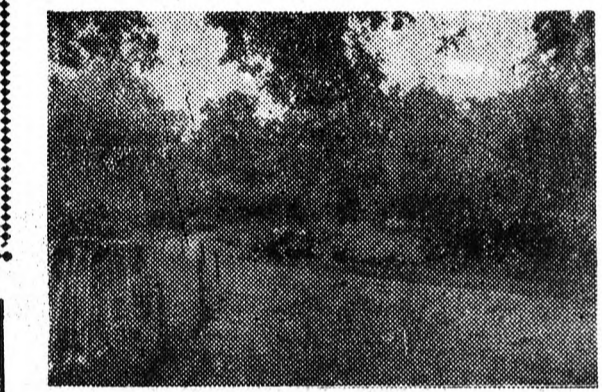
A tó partján

A Nagyerdő azonban még teljes pompájában ragyog. A fűrésztelep mögötti tó partján pompás vörös kannák, sárga és fehér georginák most vannak virágzásuk teljében. Ezek a virágok már nem hamvasak, mint a koratavasziak, a narciszok, vagy tulipánok, hanem érett szépségűek, mint egy középkorú szép asszony. A nap rásüt a füzesekre, amelyek agai bánatosnak