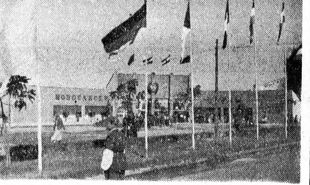
A kiállítás bejáratánál ott leng a magyar zászló is. Jelölve, hogy a mi országunk is részt vesz a vásáron

dig nagyon kellemetlen volt a honfitársaknak, hiszen a komoly érdeklődőknek sem tudtak ismertetni a fűzetet adni. Nagyon gondtal kellene öközíteni egy ilyen komoly nemzetközi vásárra induló csoportot. Egyébként a magyar juhok is jól szerepeltek, mert a bírálóbizottság arany érmmel tüntette ki a merinói kosokat.