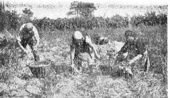
A száraz időben nem jól fizetett a burgonya, 30-40 mázsát ad csak holdja. Szorgos kezek most szedik fel a burgonyát, hogy helyébe még az ősz folyamán búza kerüljön.