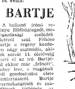
Illusztráció De Vries „Bartje” című most megjelent regényéből.

Jómódú vidám angol fiatalemberek útrakeréknek, hogy kutyájukkal együtt kétételes csónakkirándulást tegyenek a Themzén. Utközben nem történik velük semmi különös, tehát a humor forrása nem a meszeszöveg. A mi ellenállhatatlan nevetésre kését, az az a mód, ahogyan a szörző a történetet és a történetbe beágyazott több kisebb anekdotát elmondja. A nevetés mellett a természet szeretete, a Themze parti angol városok rövid szintén mulatságos jellemzése egészíti ki a három barát történetét.