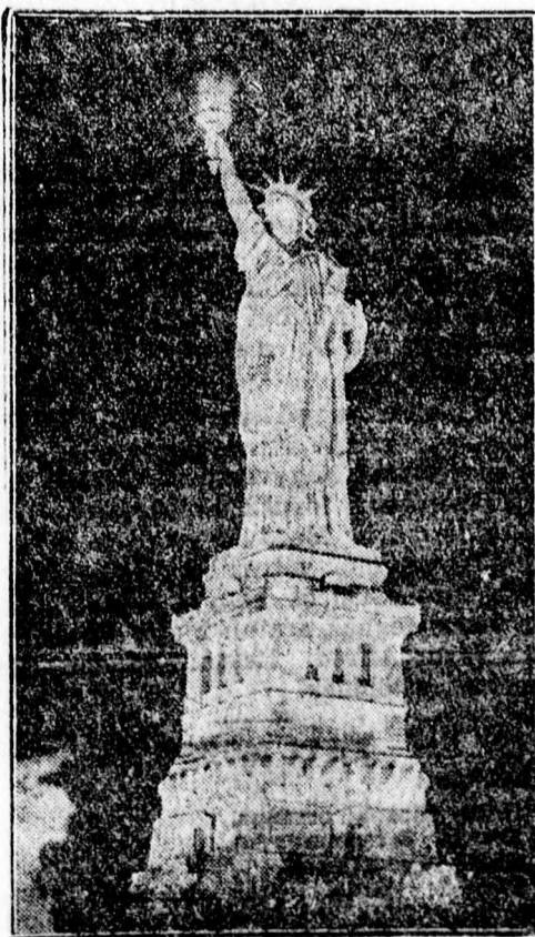
A newyorki szabadság szobor, amelynek ötven év óta szünet nélkül lobogó fáklváját a mult héten dühöngő vihar kioltotta.

Ezzel még nincs befejezve a jelentkezők elhelyezése, mert a rendezőség értesített, hogy újabb folytatást fog küldeni.