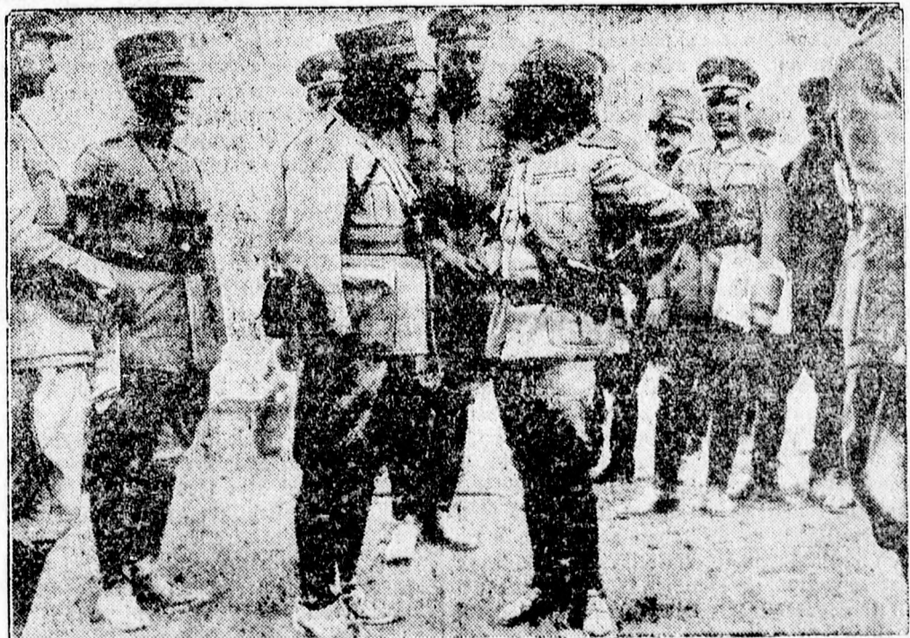
Az olasz hadgyakorlatok utolsó jelenetei a Piemonti Alpokban

Hétfőn a Gyilkos tóhoz rándultak át, míg a megjelentek egyrésze már vasárnap este elhagyta a kis várost, amely tárt karokkal fogadta és szívéhez ölelte látta el a vendégek óriási tömegét.