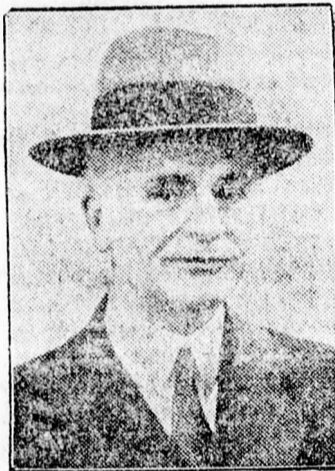
A. Sumner Welles, Molej utóda,

Nagyváradon is megkezdődött a kormány búzavásárló akciója. A kormány az ország egész területére kiépítette már azt a szervezetet, amelynek feladata a búzaárak esésének állami bevásárlások útján való ellensúlyozása. Beavatott forrásból nyert értesülésünk szerint a kormány a Nagyváradon és Biharmegyében eszközözendő bevásárlásokkal a „Federala Crisul” szövetkezeti céget hívta meg, amely már eddig is tekintélyesebb mennyiségű vásárlásokat bonyolított le. Ennek tulajdonítható részben, hogy a búzaárak hajlandóságot mutatnak a 310—330 lei körüli stabilizációra. A hétfői gabonapiac nagyobb felhozatal, de aránylag lanyha kereslet mellett folyt le. Érdekes tünet, hogy jelentékenyebb vásárlások leginkább a Bánság részére történnek, ahol a terméseredmények a bihariaknál lényegesen kedvezőtlenebbek. A helyzet tehát az, hogy míg tavaly a Bánság volt Bihar kenyérmagátára, most fordított viszonylatban a rekordterméssel dicsekvő Bihar vette át ezt a szerepet.