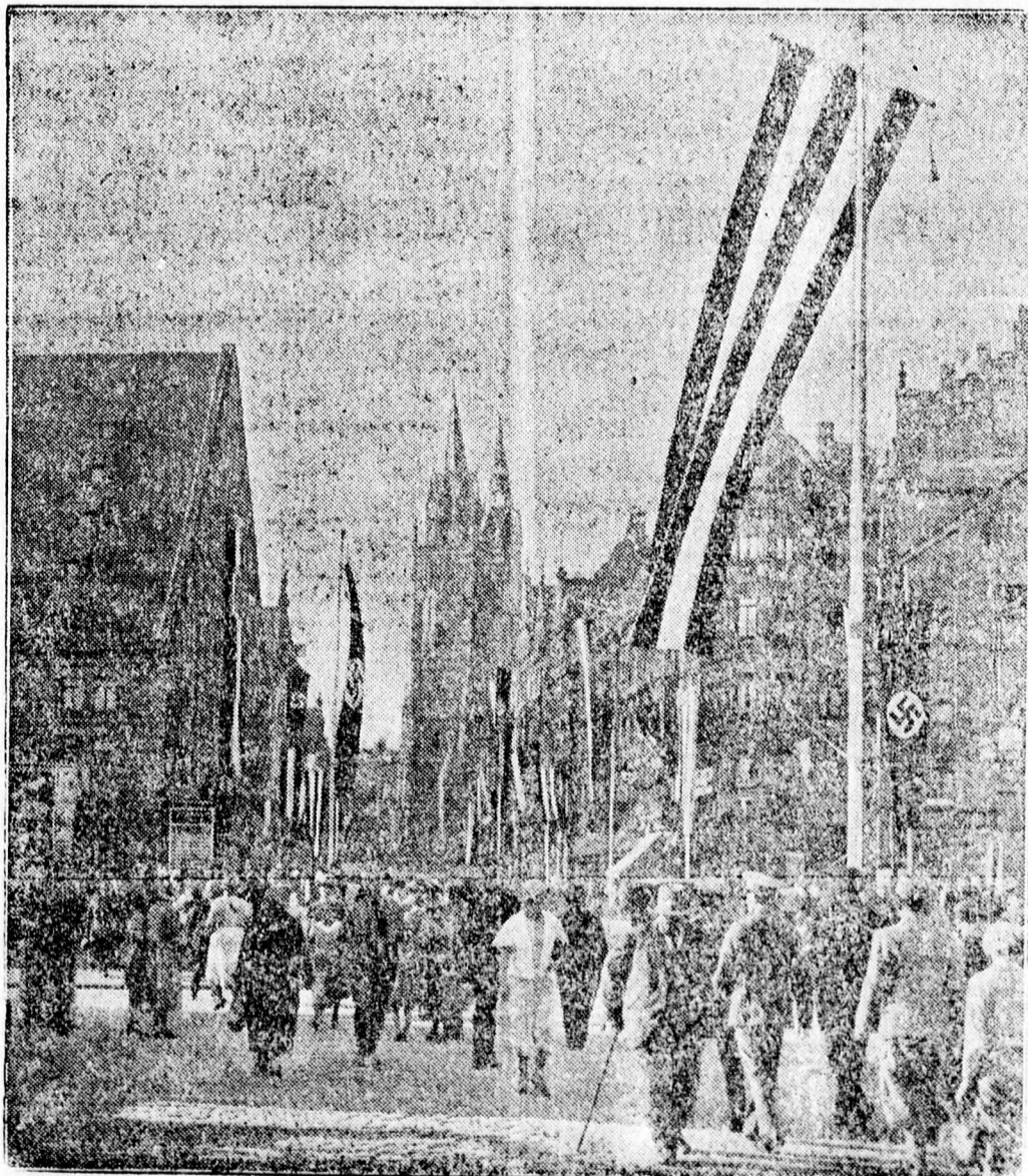
Nürnberg főterén díszben a nemzeti szocialisták pártkongresszusán

Kapható az Erdélyi Lapok könyvosztályánál.