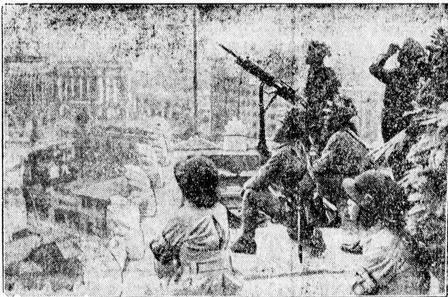
Tokióban a légi támadások ellen védkeznek

Budapesti filléres-gyors 1200 utassal pénteken hajnalban érkezik Romániába. Kolozsvár. Saját tud. Péntek hajnalban egy 1200 személyes filléres-gyorsvonat indul Budapestről Romániába. A filléres-gyors utasai közül 450 Nagyváradra, 500 Kolozsvárra, 100 Szatmárra, 100 Bukarestbe és 50 Szovátára utazik. A vonat pénteken délután érkezik meg Kolozsvárra.