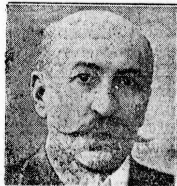
Georges Leygues francia tengerészeti miniszter

A Daily Telegraph szerint a tárgyalások legfőbb pontja az angol tervezetnek a maghatalmak tényleges haderejére vonatkozó határozata lesz. Normann Dawis és Sir John Simon beszélgetés során Normann Dawis biztosította az angol külügyminisztert, hogy az Egyesült Államok hajlandó támogatni a fegyverkezési ellenőrzési javaslatot. Azonban ennek a fejében azt kívánja, hogy Franciaország és a többi katonai államok bizonyos mértékben maguk is hajtsák végre a tényleges leszerelést.