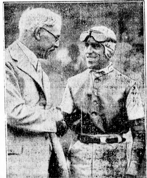
MacDonald angol miniszterelnök gratulál Nuvolarinak, a belfesti autóverseny olasz győztesének, aki 126 kilométeren főlényesen győzött.

Román-francia szakos tanári állásra pá- lyázatot hirdet a szárszregeni román kat. gimná- zium. Fizetés 3500 leiig. A pályázatot szept- ember 14-ig kell beküldeni.