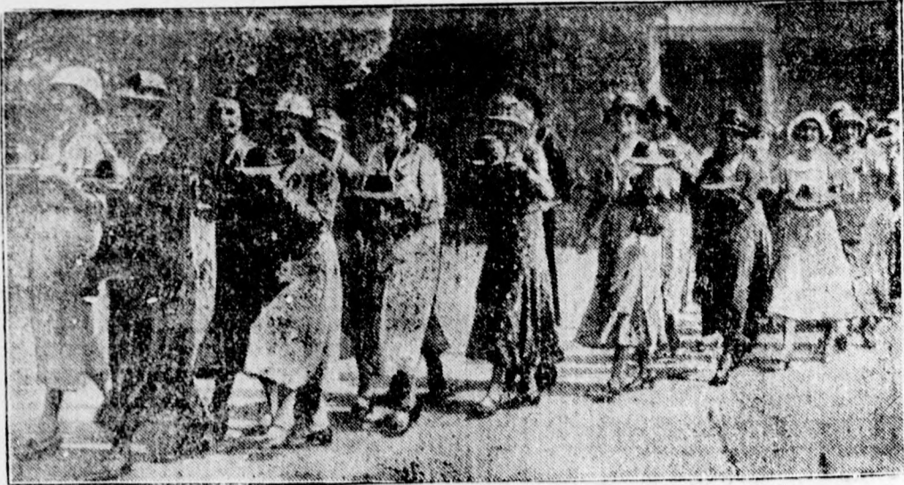
Pudding körmenet Angliában

Somerset angol községben az arató ünnep utolsó jelenete a pudding körmenet, amikor az arató nők és a földbirtokosok feleségei és leányai közösen vonulnak fel a plébániához puddingjaikkal. Onnan a község főterére mennek, ahol ezt a nemzeti eledelüket felosztják az ünnepség résztvevői között.