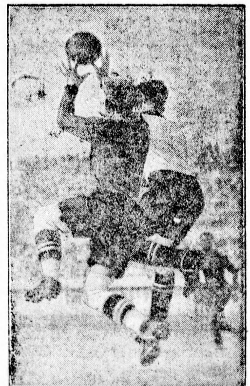
A torinói főiskolai világbajnokságról