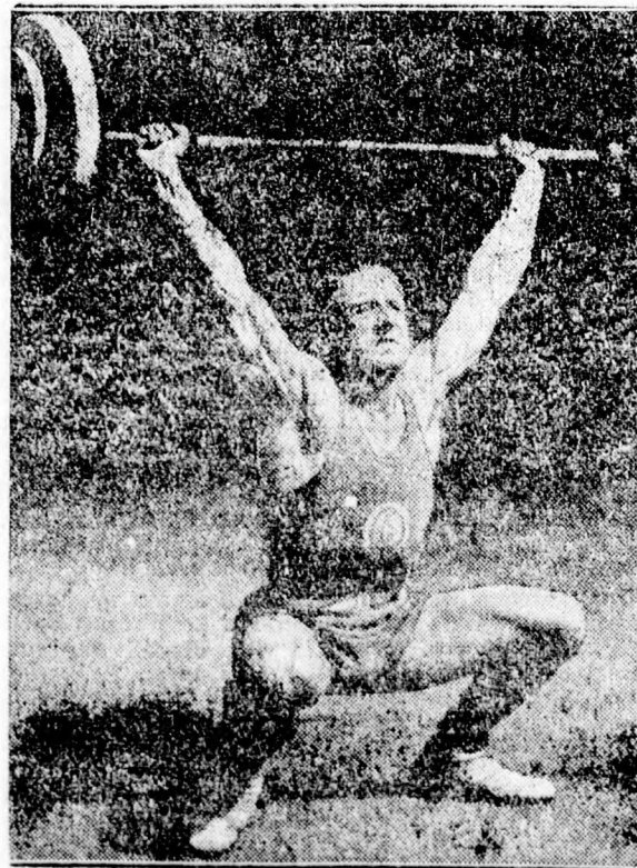
Német súlyemelő bajnok