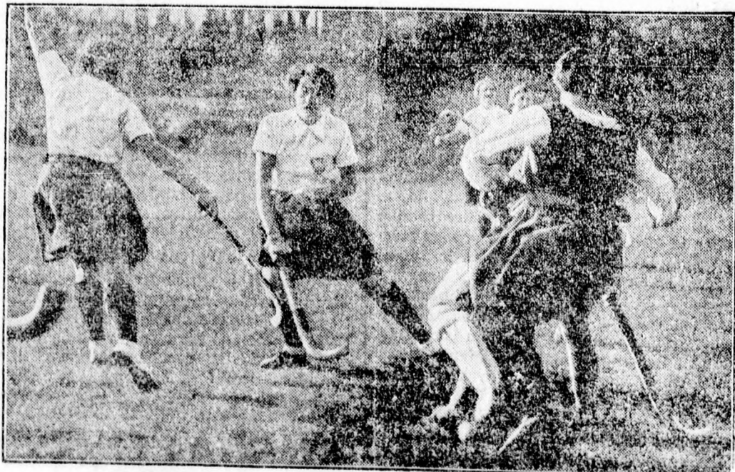
Németország—Irország nemzetközi női hokkimérkőzés Hamburgban