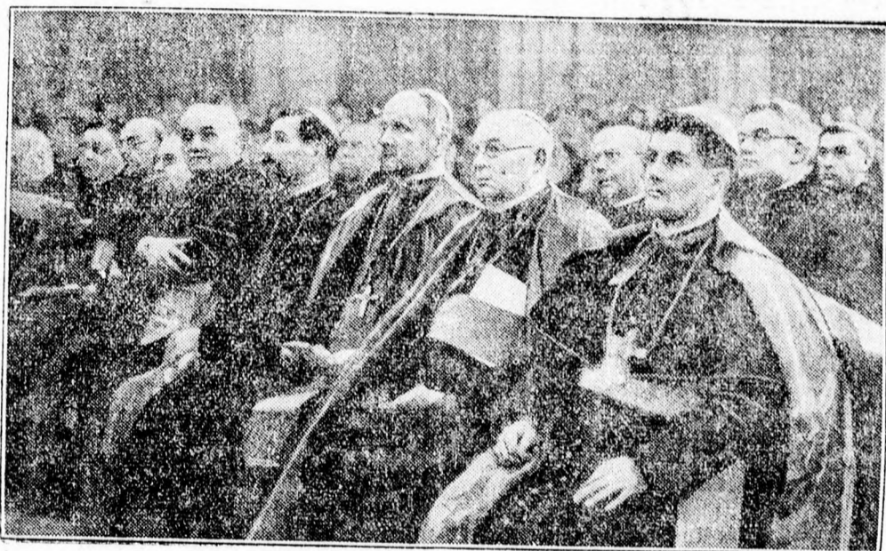
A harmadik Krisztus király ünnepség Párizsban.

Minden katolikusnak meg kell ismerkednie szent hite kulturértékével! Még ma rendeljük meg a KATOLIKUS LEXIKONT!