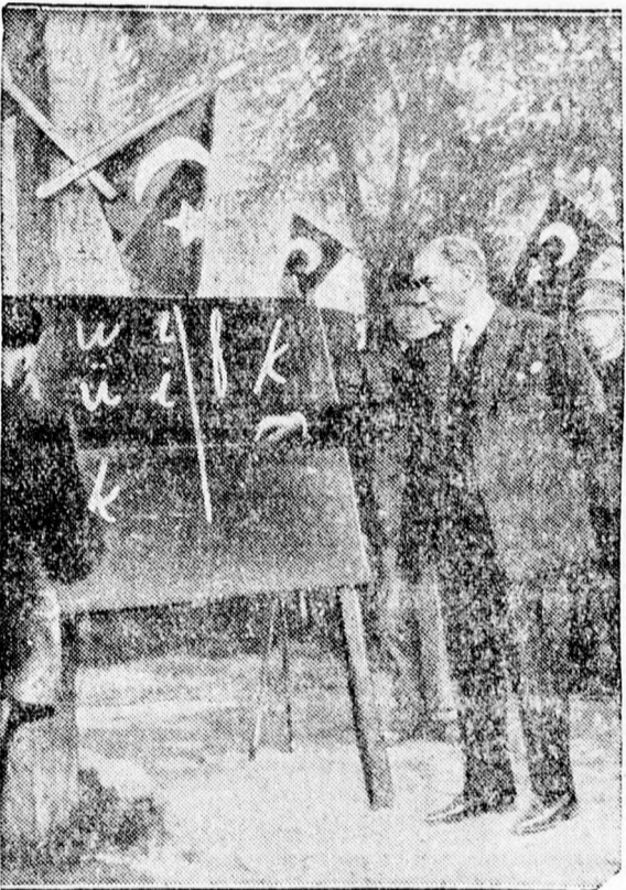
Kemál pasa az iskolában. Tíz éves a török köztársaság