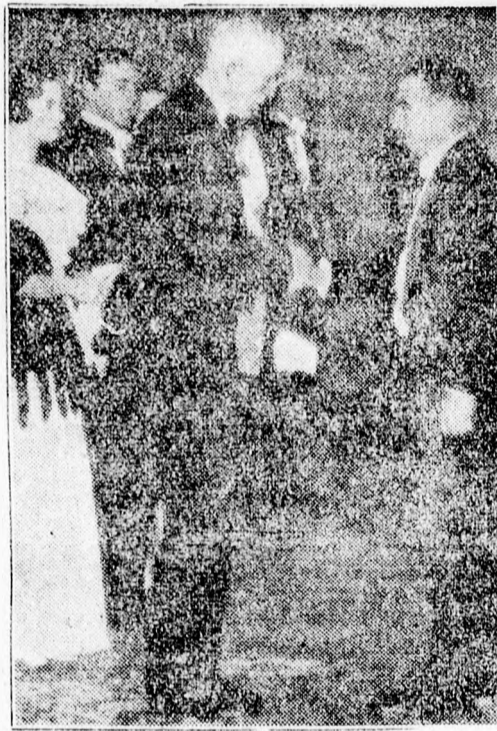
A stockholmi Nobel-díjkiosztásról készült eredeti táviratkép.

1169 munkanélküli jelentkezett segélyért Temesváron. Saját tud. Temesvár városa megnyitotta a népkönyvtár, számszerint három és az éjjeli menedékhelyet is. Eddig a városnál 1169 munkanélküli jelentkezett segélyért, akik 2438 családtagot jelentettek be. Ezidőszerint tehát összesen 3607 személyről fog gondoskodni a város.