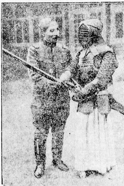
A japán hadügyminiszter vívógépemberével.

Nagy vasúti katasztrófa Oroszországban. Varsóból jelentik: Kerülőúton érkezett moszkvai jelentés szerint Stalingrádban rendkívül súlyos vasúti szerencsétlenség történt. Egy tehervonat, amely vasat szállított, összeütközött egy személyvonattal. Mindkét vonat mozdonya, valamint a személyvonat legtöbb kocsija pozdoriává tört. Az össze nem tört kocsik kiskiklottak és lezuhantak a magas töltésről. A halottak számát nem lehet tudni, mert a szovjet hatóságok szigorúan titokban tartják a szerencsétlenséget és a lapoknak sem szabad egyetlen sort sem írni róla. Egybehangzó jelentések szerint háromszáznál több halottal kell számolni.