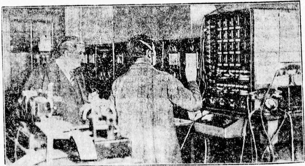
Ellenőrzik az éterhullámokat.