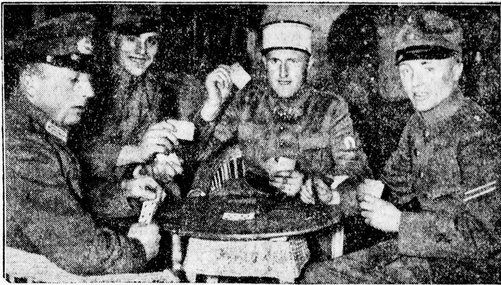
Nemzetközi barátkozás a berlini lovaglőversenyen.

Belgrádból jelentik: A szkupstina pénzügyi bizottsága Georgevics pénzügyminisztert ismételtén leszavazta költségvetési javaslatával. Minthogy a Srskics-kormány ugyanezen bukott meg, politikai körökben a kormány helyzetét megingottnak tekintik. Azonban a beavatottak azt is tudják, hogy kormányválságról jelenleg mégse lehet szó, mert a Balkán-egyezmény érdekében való belgrádi négyes találkozót nem akarják belpolitikai kérdésekkel zavarni.