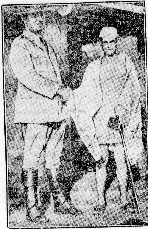
Az „amerikai Gandhi“.

Katolikus papok élete Szovjet-Oroszországban. (Varsó). Orosz fogságból kiszabadult katolikus papok érdekes dolgokat beszéltek el azokról a szenvedésekről, amelyeket a bolsevik börtönökben kellett kiállaniok. 1932 július 6-án — mondotta az egyik kiszabadult pap — több társammal a Kremlbe hurcoltak, ahol Pauker komisszár vett át bennünket. Ez az ember valószínűleg örjögött, amikor meglátott bennünket, káromkodott, szidta a papát, mert nem feleltem kérdéseire. Julius 12-én Archangelsk felé vittek a Fehér-tenger környékére s ott több hónapon keresztül egyedül voltam egy börtön cellájában. 1933 január elsejétől kocsisokká tettek egy gazdaságban, ahol lovakat, teheneket gondoztunk. Itt már majd elpusztultunk az éhségtől. Táplálékunk főtt csalan, tengeri kagyló és béka volt. Amikor egyik fogolytársunknak sikerült megszökni, megerősítették az őrséget. Julius utolsó napjaiban a Solov szigetre hurcoltak s újra magánzárkába helyeztek. Augusztusban minden felvilágosítást megtagadva, repülőgépen ismét a Fehér-tenger mellé vittek. Onnan Moszkvába toloncoltak és a Butyrki börtönben helyeztek el. Október 19-én Kownoba kerültünk mint cserefoglyok és kiszabadultunk.