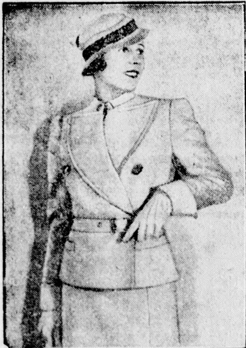
Az új tavaszi divat

Ujabb heves földrengés a Ganges völgyében. Ismét heves földrengés rázkódtatta meg a Ganges völgyét. A földrengés ugyanazon a vidéken pusztított, mint a januári földrengéskatasztrófa. Bár az első órákban még nem lehet megállapítani, milyen terjedelmet öltött ez az újabb elemi csapás, kétségtelenné látszik azonban, hogy egyes vidékeken ismét nagy rombolást vitt végbe. Sítmani és Grissa városokban több ház rombadólt s az utcákon hatalmas szakadékok képződtek a földben, amelyekből forró víz tör elő. Hogy hány halottja van az újabb földrengéskatasztrófanak, azt csak később lehet majd megállapítani.