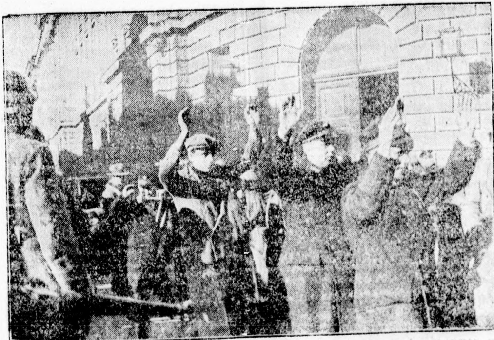
Felcsútt felkelőket felemelt kezekkel kísérték Bécs utcáin a kormányvezetők.

ZSIDEK J. kegytárgy-gyára RADNA, Jud. Arad.