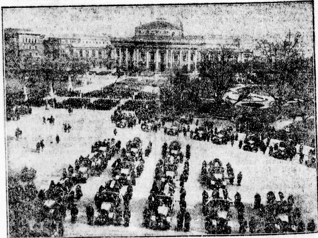
A bécsi nagy temetés.

A sok aktualitás között szó kerül a leszerelésről is. Természetes, hogy a hollandusokat minden szempontból érdekli a kérdés. A gyarmat veszélyben és sohasem lehet tudni, mikor jön valami nyomás az óházára — Kelet felől. Csodálatos, ennek a kis birodalomnak még nincsen militarista szelleme, mint amilyen például Belgiumból kiárad. Nyugodtan itélik meg ezt a problémát és ha a leszerelési konferencia olyan eredményre jutna, hogy minden állam megvalósítja az ideális leszerelést, a hollandus hadsereg létszáma annak is alatta marad. A Zuidersee új gátját úgy építik meg azonban, hogy veszély esetén 60 centiméternyi vízzel lehet elborítani az országot. Amsterdam, Hága és Rotterdam védve marad . Csak hatvan centiméter kell.