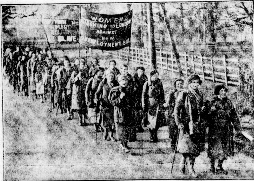
Angol asszonyok éhségtüntetése Londonban.

Réthy Alajos. B. előfizetése 1934. III. 31-ig rendezve.