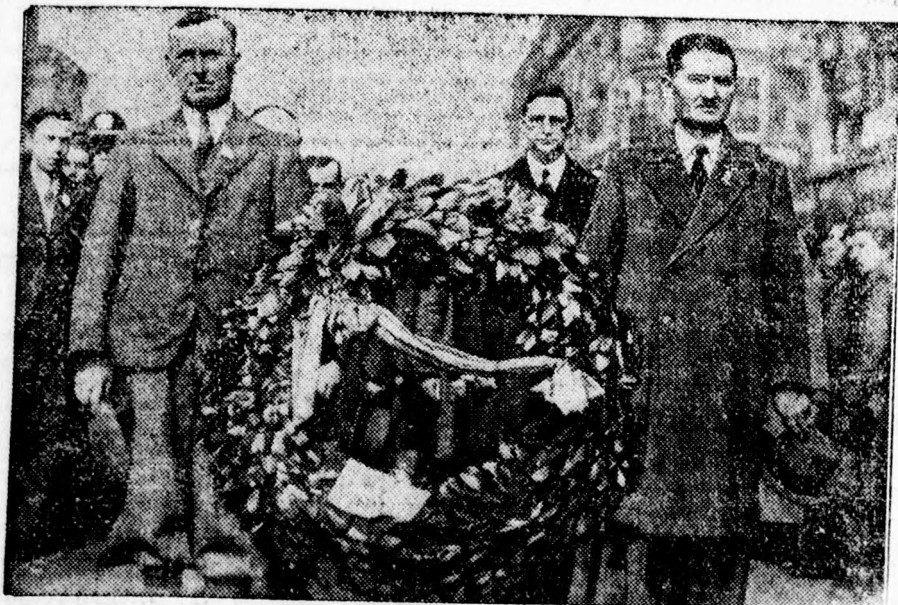
Az irországi szabadság üsők emlékünnepe.

Az 1916-iki ir szabadságmozgalmak áldozatainak sírját megkoszorúzzák. A koszorúvivők mögött De Valera áll.