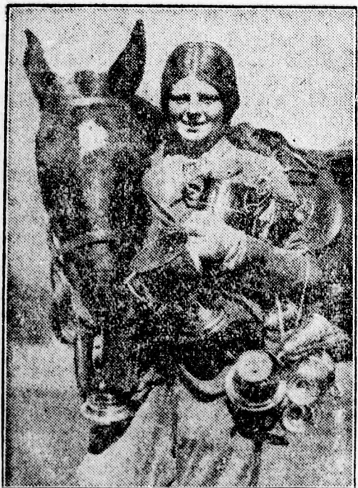
A világ legfiatalabb lovasnője, aki 285 díjat nyert.

Még mindig keresik a timișoarai kasszafurás tettesét. Timișoara. Saját tud. A Grósz Simon fűszernagykereskedő üzletében járt revolveres kasszafuró nyomára ezideig még nem akadt a rendőrség. A százezer lei értékű pénz és ékszer között, amit a rabló elvitt, mintegy száz dollár is volt. Most közzölték a tettes személyleírását. 20–30 év körüli szőke fiatalember, középtermű, hosszukás arcú. Sötét ruhában és házcipőben volt.