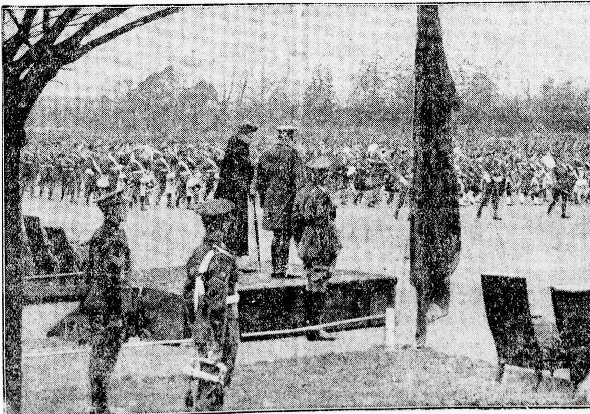
Az angol királyi pár csapatszemléje.

Mivel az ítéletbe úgy a főügyész, mint a sértettek megnyugodtak, az jogerőssé vált.