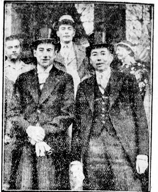
BECK lengyel külügyminiszter (balról) Bucurestiben. Jobbról TITULESCU fogadja a politikai vendéget.

Jugoszláv ujságírók és a „Hindenburg” repülőgép. Timisoara. Saját tud. A német kormány jugoszláv ujságírók egy csoportjának, amely tanulmányúton járt Németországban, a hazautazásra a „Hindenburg” hatalmas személyszállító repülőgépet bocsátotta rendelkezésre. A repülőgép Bucurestit is meglátogatta és vasárnap délután hat óra tájban Timisoara fölé tűnt fel. Az öt propelle-res, hatalmas légi jármű alacsony repülve, több ízben megkerülte az itteni repülőteret, majd nagy ívben elrepült. A „timisoara hét” alkalmával három repülőgép időzött éppen a városban. Ezek kísérték a nagy repülőt, amíg a város fölélt mozgott.