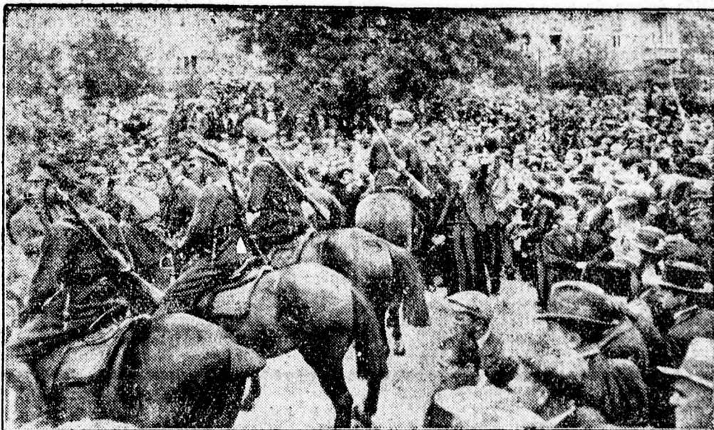
Macedonok tüntetése Szófiában.

4. A szavazás pénzügyi ellátása tekintetében a megállapodás az, hogy a költségekhez Németország és Franciaország 5-5 milliónyi svájci frankkal, a Saar-vidék közigazgatása pedig egymillióval járul hozzá.