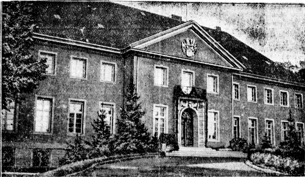
Hindenburg palotája Neudeckben, ahol kiszenvedett.

méter gáz, ez volna 148.500 vagón petrosani kőszén, ami 8500 teljes tehervonat, melynek hossza cca. 2300 kilométer. Még csak annyit, hogy a kiömlő gáz fűtőértékét (caloria) véve alapul, ez a melegmennyiség Nagyrománia három évi tüzelőanyag szükséglete és értéke milliárdokra megy.