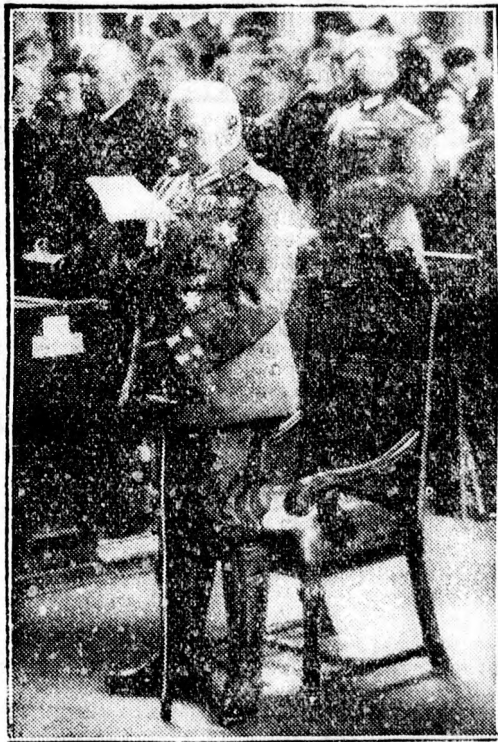
Hindenburg a történelmi nevezetességű birodalmi gyűlést nyitja meg Potsdamban, a helyőrségi templomban, 1933. március 21-én.

A kráter 369 (háromszázhatvankilenc) napig égett, vagyis 4 nappal többet, mint egy év. Ezalatt a levegőbe ömlött 922.500.000 köb-