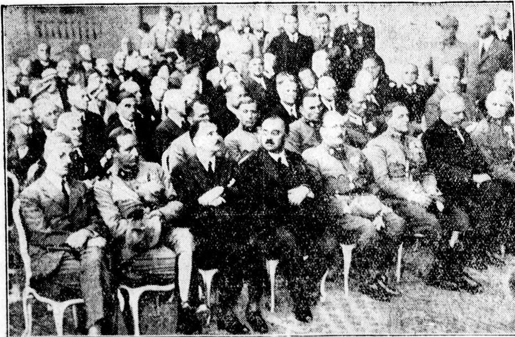
Dr Dollfuss gyászünnepélye a bécsi Hősök-terén.