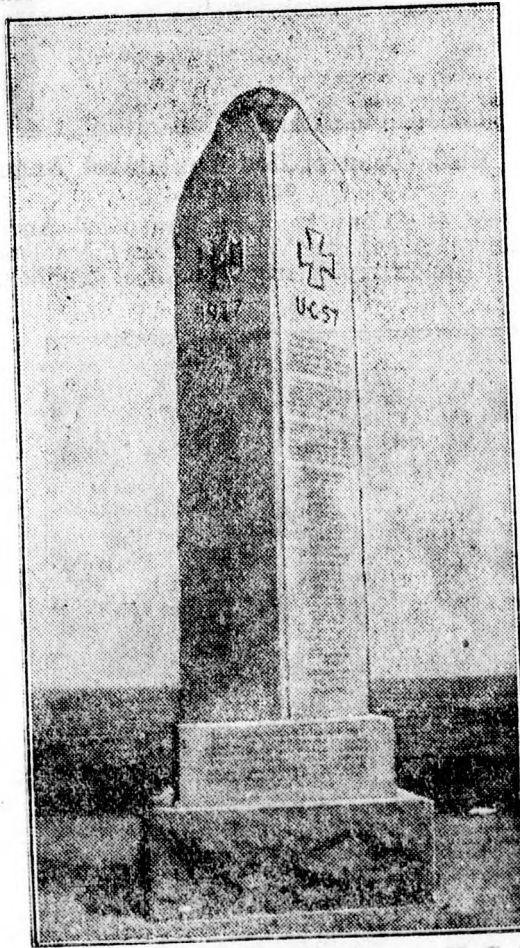
Finnország emléket állított az „U C 57” tengeralattjáró hőseinek.

Vasárnap fogják Finnországban Lovisa mellett felszentelni a német „U C 57” tengeralattjáró emlékművét. Az említett tengeralattjáró 1917. november 17-én kiképzett finn vadászokat és hadianyagot szállított Finnországba. Visszatérve aknára futott és elsüllyedt.