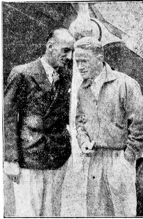
Első óceánrepülés Kanadából Angolországba.