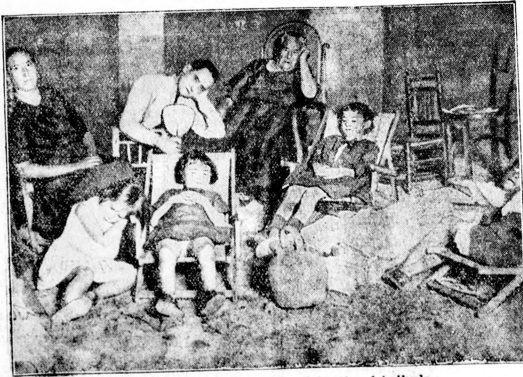
Spanyolországban tetőpontjára hágott a kánikula.

Országúti segélyhelyek és mentőállomások. Budapestról jelentik: A magyar automobilizmus szempontjából nagyjelentőségű intézményt létesített a Magyar Vöröskereszt Egylet. Elhatározta az országúti mentőügy megszervezését a nyugati államok mintájára. Minden segélyhelyet a nemzetközileg elfogadott zománctábla jelez kék alapon fehér mezőben nagy vörös kereszt. Ezenkívül az országúti patkójának mindkét oldalán száz méterrel a segélyhely előtt és után szintén tábla hirdeti a segélyhely közelségét. A 190 km. hosszú bécsi országúton húsz segélyhelyeket állítanak fel. Átlag minden 10 kilométerre esik egy segélyhely. A húsz segélyállomás közül tizenöt segélyállomás és öt mentőállomás. Az országúti szervezettel párhuzamosan folyik a munka vízi mentőállomások létesítésére is és úgy, mint a Dunán és a Balatonon megszervezik a viharjelzést. A vihart sorozatosan feleresztett léggömbökkel fogják jelezni. A léggömbök megjelenése pillanatában a dunai csónakosok nyomban tudomást szereznek a közeledő viharról s idejében menekülni tudnak.