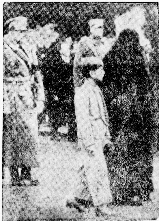
A belgrádi nagy temetésről készült képtávirat.

Belgrádból jelentik: Ismeretes, hogy Ante Korosec Antal prelátus, a szlovén néppárt volt vezére a Sándor király halálával kapcsolatban tanúsított lojális magatartása elismeréseként kegyelmet kapott. Hír szerint a régenstanács határozata alapján további három szigorúan elítélt szlovén politikai vezérnek kegyelmeznek meg.