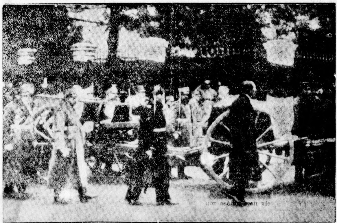
A belgrádi nagy temetésről készült képtávirat. Sándor király koporsóit szállító ágyutalp, amely a királyi várból a székesegyházig vitte a királyi koporsót.