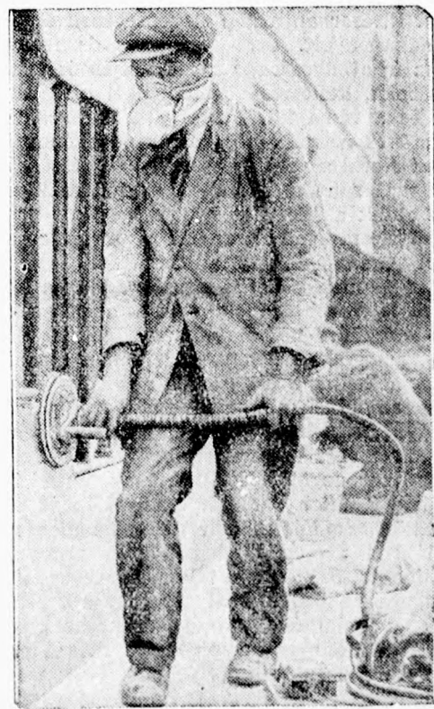
Por ellen védő álarc.

A közművelődési tanácsban a római katolikus egyház 8, az evangélikus egyházak 6, az izraelita hitközségek 1—1 tagja foglal helyet. Ugyanebben a tanácsban a tudomány és művészet négy-négy képviselőt kapott.