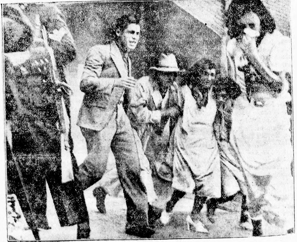
A mexikói kultúraarcokból.

bejárattal csinosan butorozott szoba kiadó. Oradea, Str. Nic. Zsiga 7.