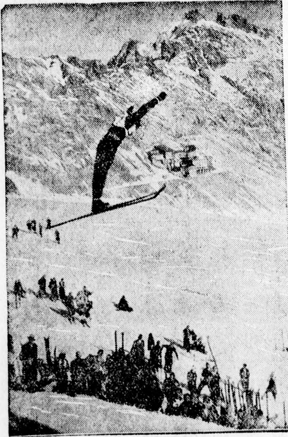
A norvég Birger Ruud nyerte meg Németországban a „csúcsugrás-serleget”.

Sherill saját bevallása szerint tréningje közben egy izben véletlenül jött rá az új módszerre, amikor ülteből felig felemelkedve nekiiramodott. Azután tudatosan kísérletezett. A mélystart felfedezője ma is él. Előbb