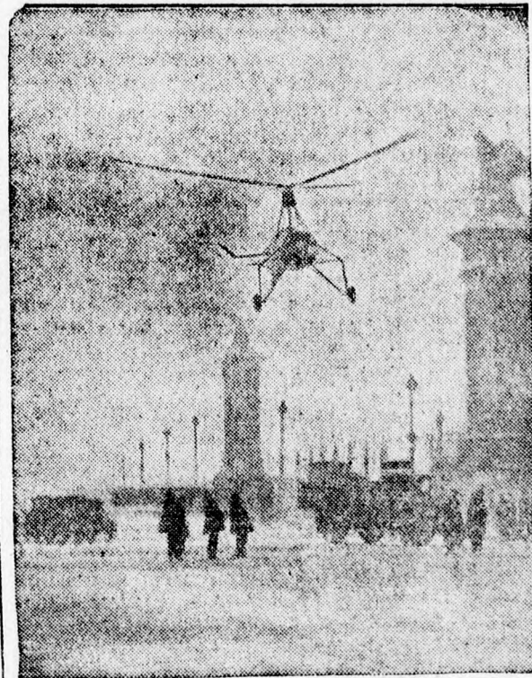
Különös repülőmutatványok Párizs utcáin a légügyi és tengerészeti miniszterek jelenlétében.

Londonból jelentik: A Reuter Santiago de Chilei jelentése most már hivatalosan is megerősíti Salamanca lemondását. Nem hivatalos helyről közlik, hogy Salamanca -t repülőgépen Santa Cruz -ba szállítják és ott hadbírótság elé állítják.