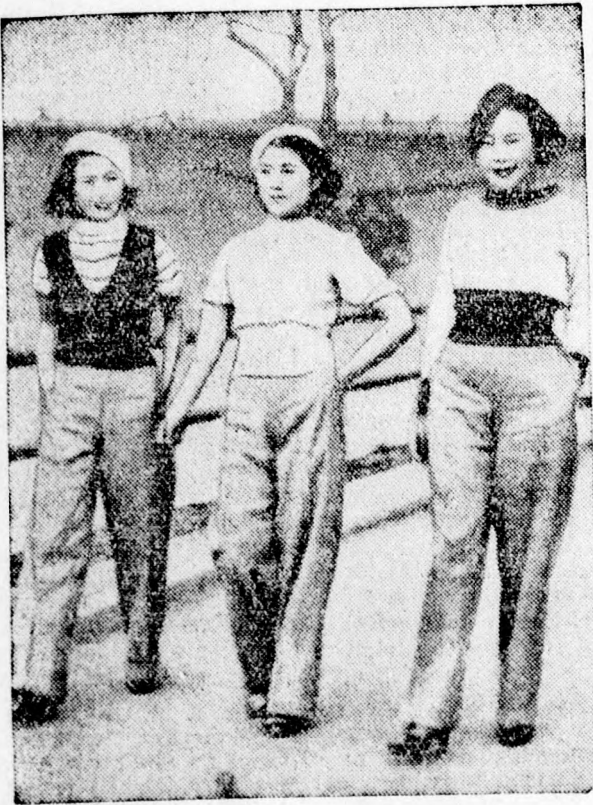
Divatos japán hölgyek Tokió főutcáján.