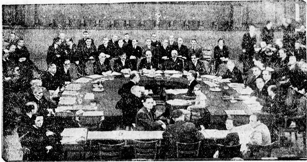
A genfi Népszövetség kedden délután kezdte újból tárgyalni a Saar-kérdést.

Képünk a legutóbbi tárgyalásokról készült felvétel, amelyen Benes, Laval, Aloisi, Eden és Litvinov is részt vettek.