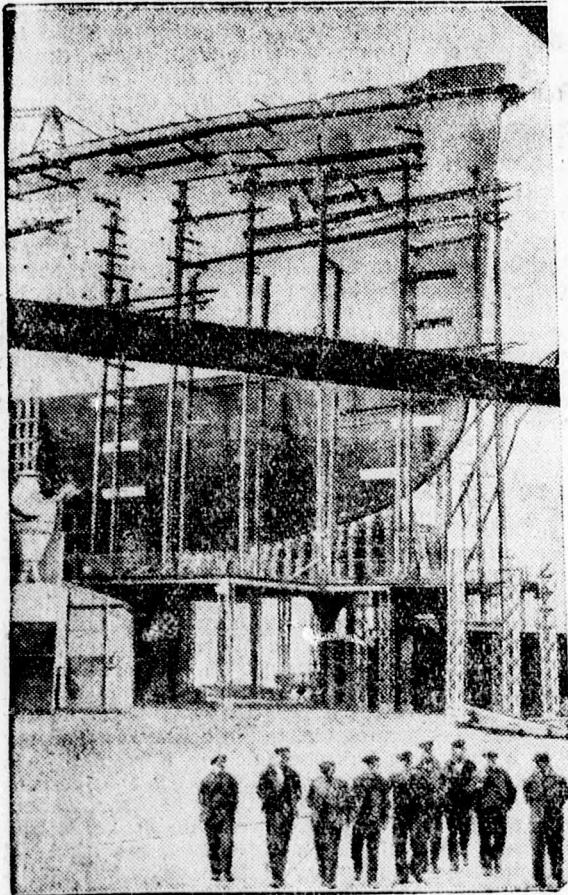
Az angliai Gunard Line új hajóóriása.

Alig bocsátották vízre az utóbbi idők legnagyobb hajóóriását, az angliai Glasgow hajódokkjában újabb óriáshajón dolgoznak, amelynek méreteivel az angolok bámulatba akarják ejteni a világot. Ez az új óceánjáró tizenhat méterrel lesz hosszabb a világ eddigi legnagyobb hajójánál.