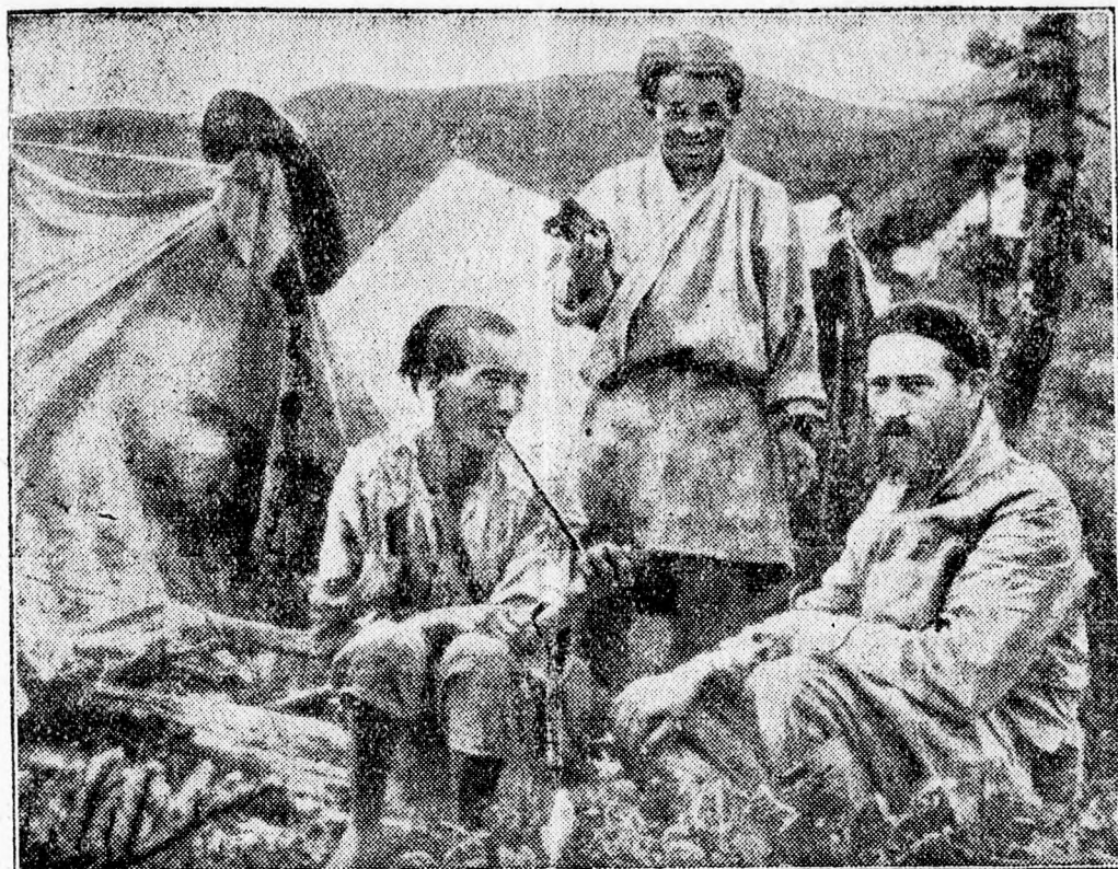
Szent Bernát remetéi a Himaláján.