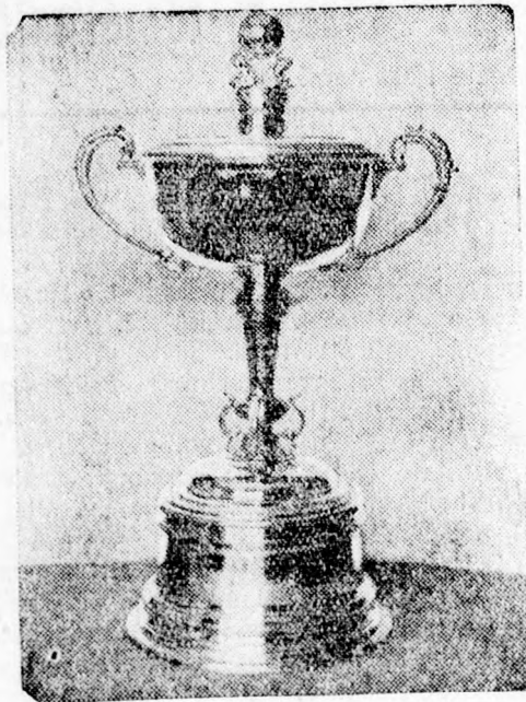
Az egyiptomi király aranyserlege.

Az értéktőzsde hivatalos árfolyamai. Devizák: Párizs 6.63 háromnegyed—6.58 fel. London 503—493. Newyork 109.50—99.50, Milánó 8.74—8.57, Zürich 32.97—32.57, Brüsszel 23.55—23.30, Berlin 41.50—39.50, Amszterdam 68.30—67.65, Madrid 14—13.60, Varsó 19—18.75. Valuták: Párizs 6.60 6.90, Zürich 32.55—33.40, London 490—500, Newyork 98—112, Brüsszel 23.50—23.80, Milánó 8.65—9.20, Madrid 14—13.60, Amszterdam 67—69, Berlin 38—40, Bécs 25—24, Szófia 1.05—1.70, Prága 4—4.50, Varsó 18.80—19.50, Belgrád 2.20—2.50, Budapest 24—26, Athén 0.80—1.10, Istanbul 78—81 lei.