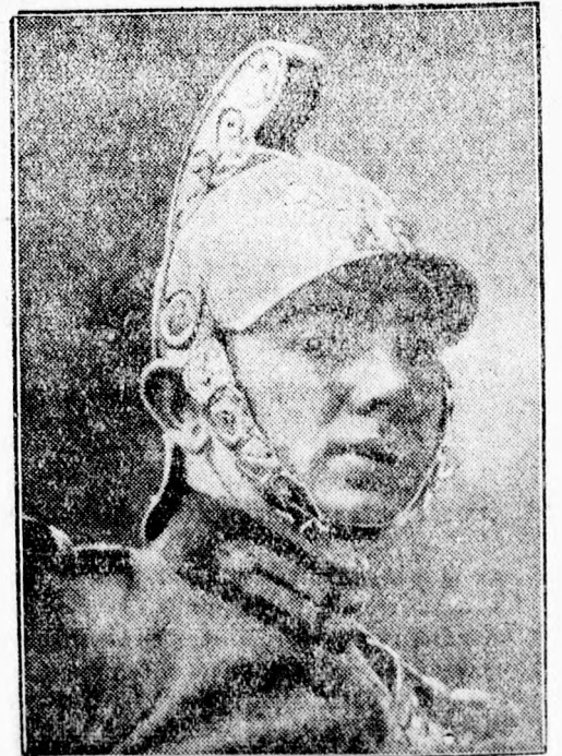
A spanyol köztársasági elnök testőrségének művészi veretű új sisakja.