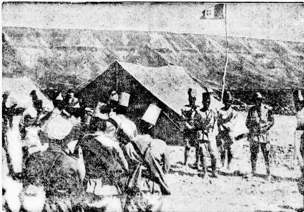
Nehéz harcok az abessziniaiak és olaszok között.