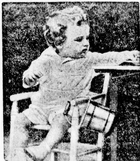
A világhírű Lindbergh-baby,

Vasárnap délelőtt 11 órakor: Itt a szerellem. — Délután 3 órakor: Nápolyi kaland. — Délután 6 órakor: Cirkuszhercegnő. — Este 9 órakor: Tájtárjárás.