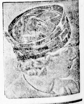
Kiadja az Erdélyi Lapok Lapkiadó Rt.