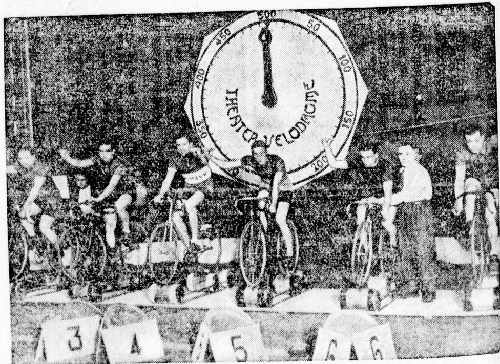
Hatnapos kerékpárverseny — egy helyben.