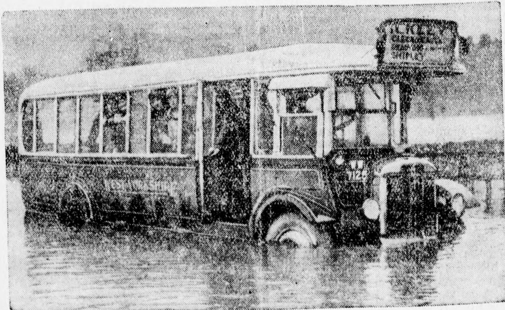
Anglia árterületein tengelyig érő vízben gázolnak az autóbuszok.

Kiadó 4 szobás modern lakás május 1-re Bul. Reg. Ferdinand 7-a alatt. Értekezni: Oradea, Str. Tache Jonescu 15. sz.