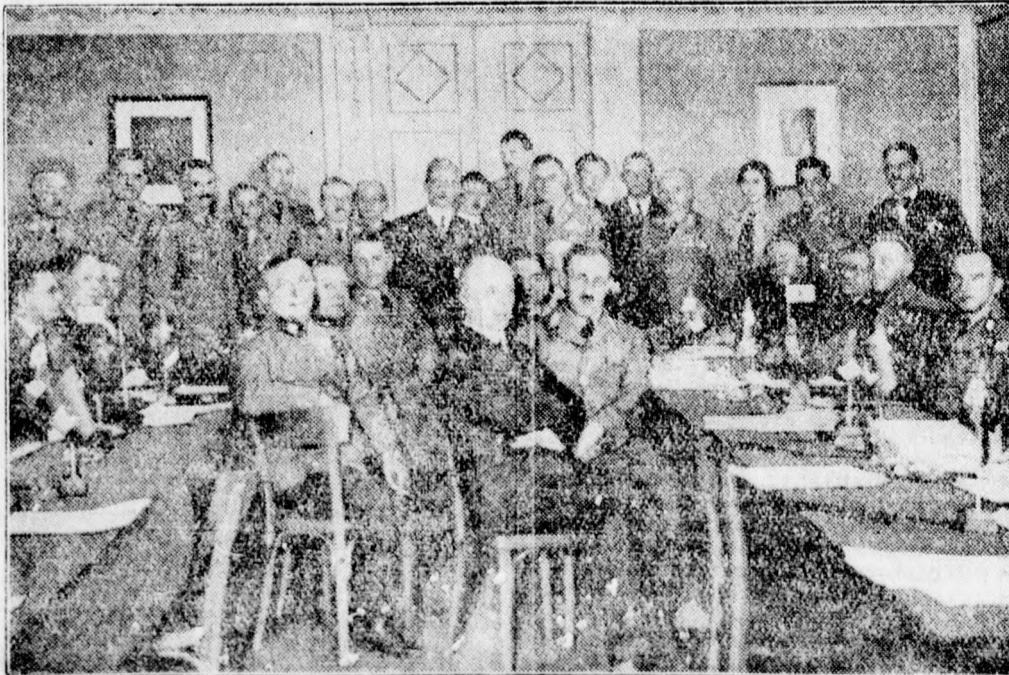
Ausztria egységes polgárőr testületet alapít.

A földalatti folyosó titka. Varsói jelentés szerint Vilnában a dominikánusok kolostora alatt egy nagy földalatti folyosót fedeztek fel. A folyosóból ajtó vezet egy terembe, amelyben igen sok elhalt rendtag koporsója van elhelyezve. Egy másik teremben számos férfihullát találtak egymásra dobálva, amelyek — minthogy légmentesen voltak elzárva — ugyszólván teljes épségben maradtak meg. Azt hiszik, hogy ezek a holttestek az 1863. évi lengyel felkelés résztvevői, akiket az oroszok legyilkoltak és azután ebbe a földalatti terembe dobáltak.