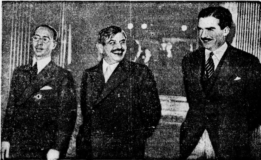
A párizsi hármass konferencia résztvevői.

A kisebbségiéknél ez a sorrend vagyonság tekintetében: luteránus, katolikus, református, unitárius egyház; a görög katolikus püspökségek között pedig a sorrend ez: gherlai, cluji, oradeai, blaji, maramureși, lugoji püspökség. Az ortodox püspökségek között a besszarábiaiak a leggazdagabbak; utánuk mindjárt az aradi, caransebeși, oradeai püspökségek következnek,