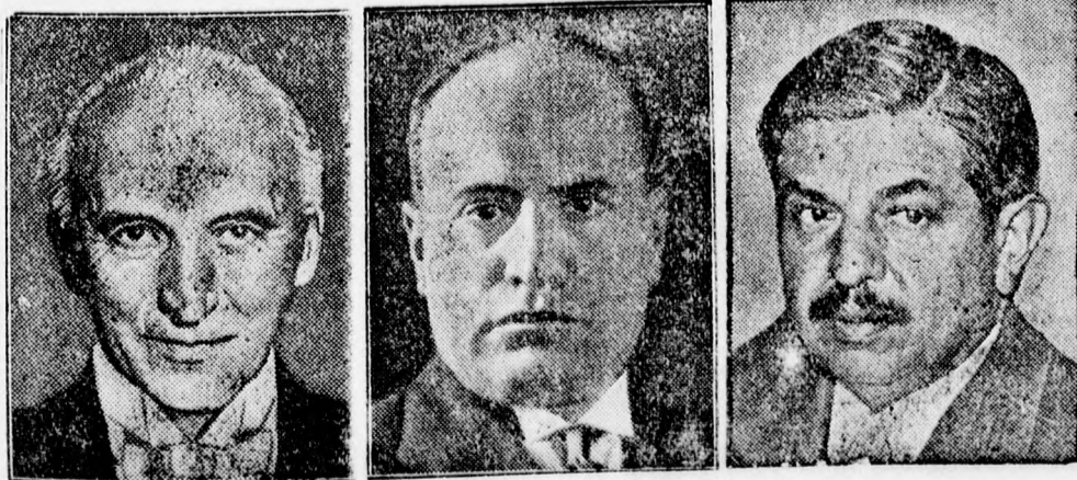
A stresai értekezlet előtt.

Legújabb értesülések szerint Genfben, mi alatt a Népszövetség ülészik, a kisanant és a Balkán-szövetség is értekezletet fog tartani. Ezen azonban Jętics aligha fog résztvenni, mert a választási előkészületek otthon tartják.