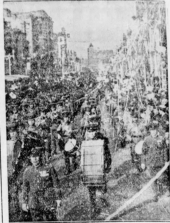
Japán a mukdeni ütközet évfordulóját ünnepli.

Mejjelentek a malomellenőrzők a carei malmokban. Saját tud. A zälauai pénzügyigazgatóság távirati rendeletben értesítette a carei állami adóellenőri hivatalt, hogy a buza- és rozsliszt 0,25 leies fogyasztási adója életbelépett. A rendelkezés értelmében hétfőtől kezdődőleg Carei összes malmaiba egy-egy pénzügyi ellenőrző közeget küldtek ki, akik a malomból elszállított liszt mennyiség kilója után 0,25 leies fogyasztási adót vetnek ki és azt nyomban bevételezik.