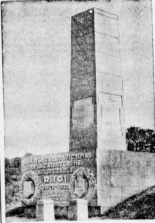
Az „R. 101” óriásléghajó áldozatainak emlékoszlopa Beauvaisban.

1930-ban ötvenegy halálos áldozatot követelt az „R. 101” nevű angol óriásléghajó lezuhanása. A szerencsétlenség színhelyén a képen kőn látható emlékoszlopot emelték