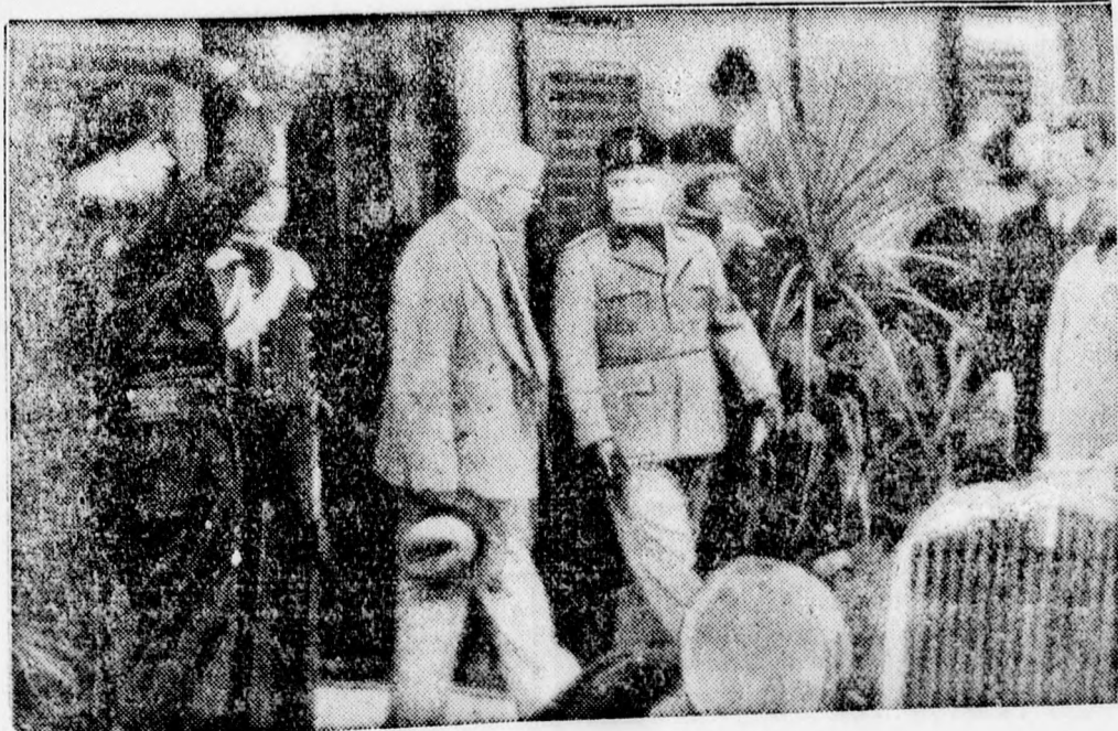
A stressai konferenciáról.

Az Echo de Paris (a hadiipar lapja) londoni jelentése szerint az angol fővárosban arra számítanak, hogy Németország a közeljövőben semmisnek nyilvánítja a Rajnavidék semlegességére vonatkozó intézkedéseket, sőt azt is tudni véli, hogy a német kormány Köln és a nagyobb Rajna-menti városok mentén rohamcsapatokat von össze és itt alkalmazza azt a rendeletet, hogy az egész belföldi haderőt a rendes hadsereg keretébe illesztik be.