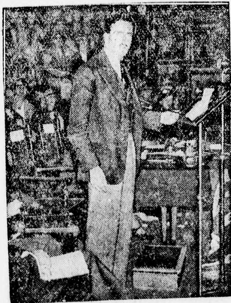
Edén angol főpecsétőr,

Belgrádi körökben kijelentik, hogy nem szabad összefüggést keresni Göring és Jettics római útja között.