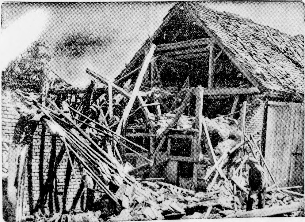
A reinsdorfi katasztrófa következtében több kilométeres körzetben összedőltek a házak.

Lenin özvegyét letartóztatta a szovjetkormány. Bécsből jelentik: A bécsi lapok értesülése szerint Lenin özvegyét a GPU letartóztatta, mert a száműzött Zinovjev és Kamenev érdekében lépéseket tett. A letartóztatás annál nagyobb felháborítást keltett, mert Lenin özvegye már 68 éves, súlyos beteg, úgy hogy nem is tudták börtönbe vinni, hanem a GPU emberei fegyveresen őrzik lakását. Itt írjuk meg, hogy Trotszkij felesége az angol lapokban nyílt levelet közölt, s azt panaszoja, hogy fiát, aki Moszkvában maradt és ott mérnök, letartóztatták. Fia — úgy mond — politikai ténykedést sohasem fejtett ki. Trotszkij felesége végül azt sürgeti leveleiben, hogy tegyék az ügyet nemzetközi vizsgálat tárgyává.