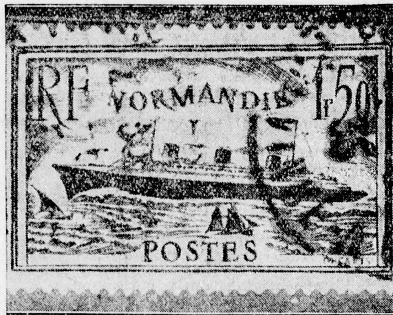
Uj francia bélyeg,

PÜSPÖKFÜRDŐI kedvezményes jevek kiadási hivatalunkban kaphatók.