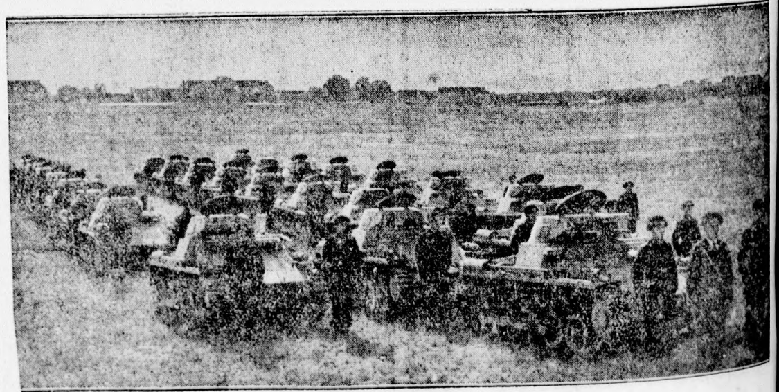
Németország legújabb hadifelszerelése.

a napokban autószerencsétlenség áldozata lett és meghalt.