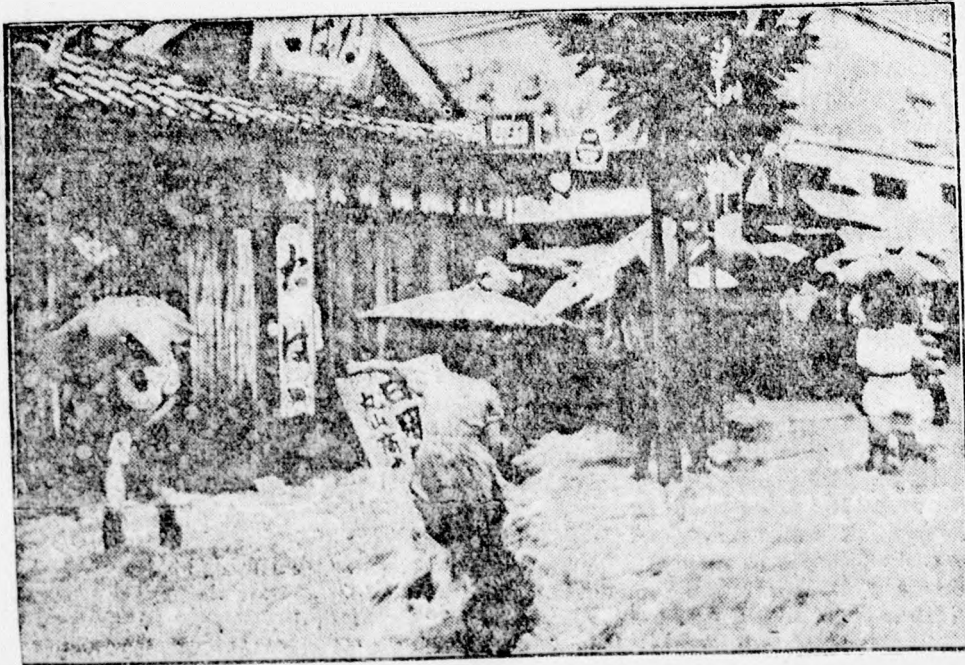
Kyoto japán várost óriási árvíz borítja.

A fiatal magyar orvos egyébként még két évig szándékozik a fekete világ részben tartózkodni, aztán szülőföldjére hazajön és megta- karított vagyonkáján nyugodalmas otthont vásárol magának.