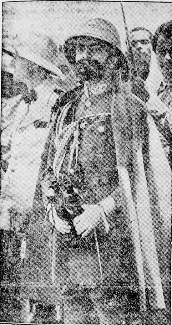
Haile Selassie, Abesszinia császára, a „negus” tábornagi egyenruhában.

A Popolo d'Italia (a Mussolini lapja) arról ír, hogy Japánt az angol sajtó hangjai biztatják rá semleges magatartásának módosítására. Aztán ez a vezető olasz lap is élesen rátámad Japánra, s szemrehányást tesz neki, hogy éppen ő akar az abesszinek pártfogója lenni az olaszokkal szemben. Holott ugyanaz a Japán volt az, mely iga alatt tartja Koreát és Mandzsuriát, s a világ legrégebbi kulturájú országára, Kinára is rá akarja tenni a kezét. A