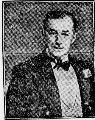
Astley Rushton, az angol tartalékflotta főparancsnoka

Forradalmi fölfedezés a zenében. New York jelentés szerint óriási feltűnést keltett Vanasek zeneszerző legújabb munkája, amely arról számol be, hogy nem kevesebb, mint 365 új zenei skálát fedezett fel a szerzője. Szakkörökben zenei szótárnak nevezik ezt az érdekes könyvet, amelynek új elmélete hallatlan forradalmat fog keleteni a muzsika világában. A párizsi Conservatoire nagydíjának nyertese az említett Vanasek , aki zenei tanulmányait Lipcsében végezte és már ott feltűnt újszerű zeneelméleti felfogásával. Egyes amerikai zeneszerzők máris az új skálák alapján kezdenek komponálni. Az új elmélet teljes feldolgozását az „ Atonal Music League ” rendezti sajtó alá.