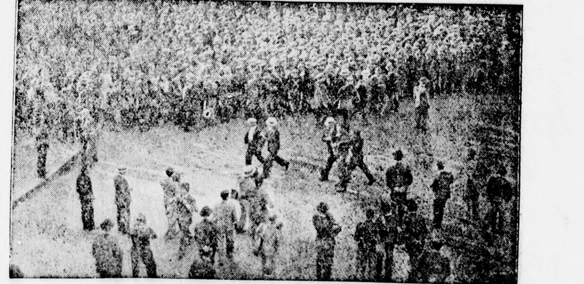
Ezerkét száz letartóztatás Párizsban. Laval szükségrendeletének életbeléptetése ellen huszezer főnyi tömeg tüntetett Párizs utcáin. A rendőrség ezerkét száz embert tartóztatott le a tüntetők közül.

Bucurest. Saját tud. Keddre várják a tóvárosba György görög király adjutánsát. Livadis őrnagyot, aki Londonból, Prágán keresztül repülőgépen érkezik Bucurestibe. Livadis őrnagy a görög restauráció kérdéséről fog fontos megbeszéléseket folytatni.