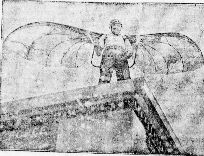
Ikarus — 1935-ben.

A jugoszlávok visszalépése folytán úgy az egyéniben, mint a csapatversenyben a románok kerültek az első helyre. Egyéniben 1. Gheorghescu (román egyéni). 2. Mormocea (román egyéni). 3. Tudose (román). 4. Daniel (lengyel). A versenyzők szerdán pihenőnapot tartanak Bacauban.