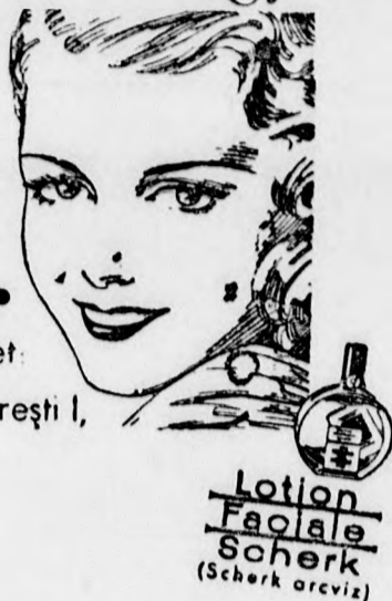
Lotion Façiale Scherk (Scherk arcviz)

«Excelsior» Calea Moșilor, 78 București I,