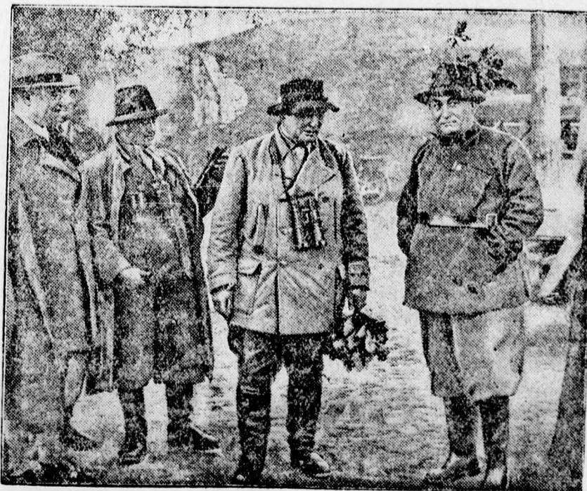
Balról jobbra: Bodenschatz főhadnagy, Körner államtitkár, Göring porosz miniszterelnök és Gömbös Gyula magyar miniszterelnök.