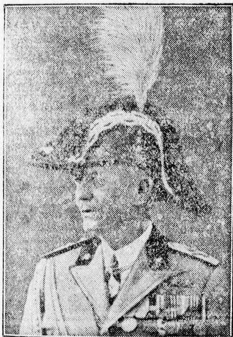
Badoglio tábornok, az abessziniai olasz csapatok új főparancsnoka.

Moszkvából jelentik: A szovjet a vörös hadsereg élére a katonai rangfokozatok visszaállításával öt tábornagyot nevez ki. Ezek: Vorosilov , hadügyi népbiztos, Tuhacsenszkij , helyettes népbiztos, Jegorov vezérkari főnök, Budjenni lovassági főparancsnok és Blücher , a távolkeleti haderők főparancsnoka.