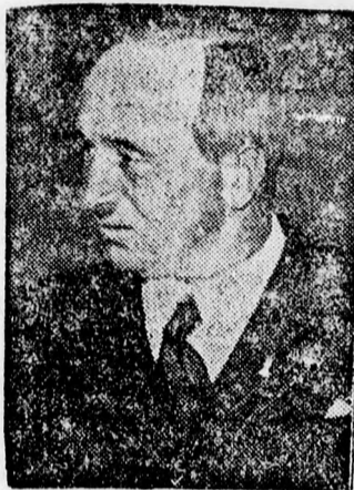
Benes, Csehszlovákia új köztársasági elnöke.

Prágából jelentik: Az elnökválasztást megelőző napon Benes kihallgatáson fogadta a külügyminisztériumban a magyar pártok küldött-ségét, mely Szűllő, Jáross és Eszterházy képviselőkből állott. A magyar képviselők előterjesztették a kisebbség panaszait és azt a javaslatot tették, hogy Benes likvidálja ezeket a panaszokat.