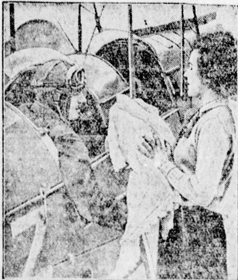
Ujszülött baba próbarepülése.