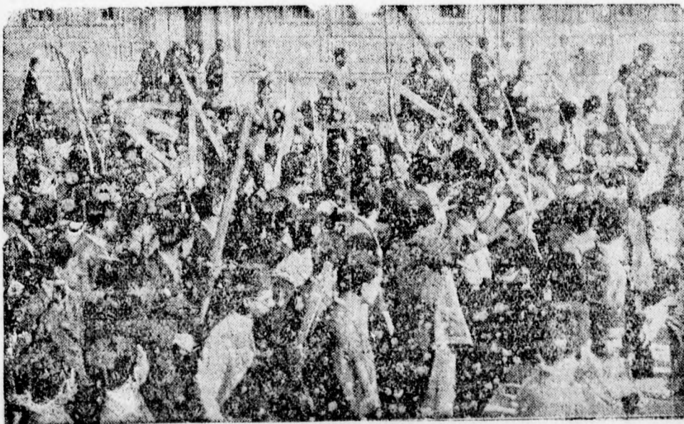
A kairói diákvargások utolsó hulláma. A rendőrséggel vívott küzdelemben tíz diák megsebesült.

Nye szenátor kérdésére ezután Morgan kijelentette, hogy a bankház aktívái 1935 december 31-ig 537 millió 943 ezer 911 dollárt tettek ki. Az elnök további kérdésére, hogy mik voltak a cég mérlegének többi adatai, Morgan már éppen felelni akart, amikor cégtársa, Lamont megrántotta a kabátja ujját. Morgan erre kijelentette, hogy nem emlékszik a számkokra.