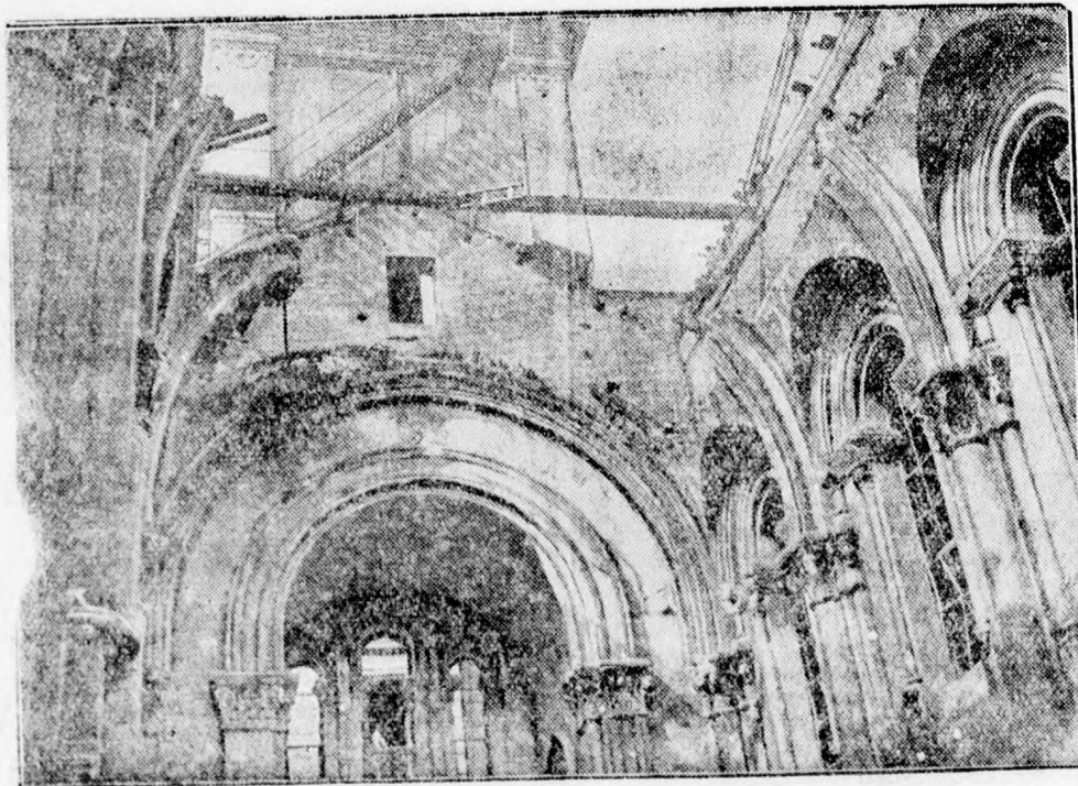
A madridi Szent Ignác templom, a kommunisták rombolásai után.

Az iszapteger elnyeléssel fenyeget egy francia falut. Párizsból jelentik: A Gap közelében lévő Batié-des-Fonds falut fenyegető iszapgörgeteg mind közelebb nyomul a faluhoz, úgyhogy a helységet egy öreg házaspár kivételével valamennyi lakosa elhagyta. Az öreg házaspár nem volt hajlandó engedni a felszólításnak és kijelentette, hogy inkább házával együtt pusztul el. A hatalmas iszapteger feltartóztathatatlanul hőkompolyóg a falu felé, amelynek külső házai nagy robajjal omlanak össze az iszap mindent elöntő tengerében. Mezők és rétek egyetlen átholhatóan iszaptegerre változtak. Valószínűleg menthetetlen az egész falu.