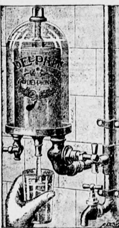
Szűrőképesség 40 liter óránként. Ára 35 kor.