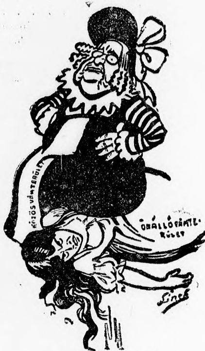
(Az édes ruthének.)