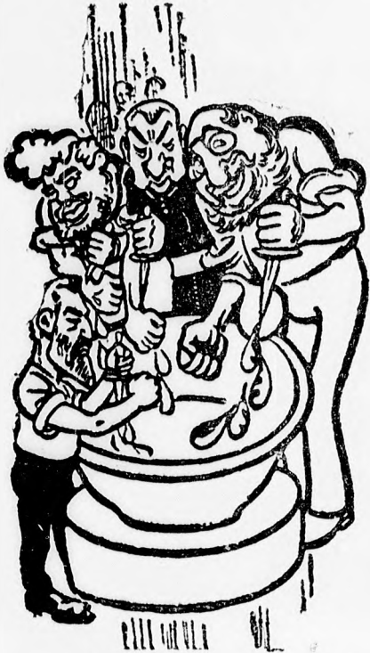
(A mostoha magyarok.)