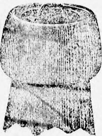
A Seal-dugóval elzárt üveg.