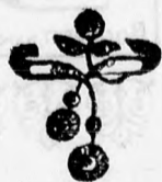
4058 szám. Arany opáltürkis v. gyöngyvel 4 frt. 50, gyémánt 25 frt. brilliánt 100 frt