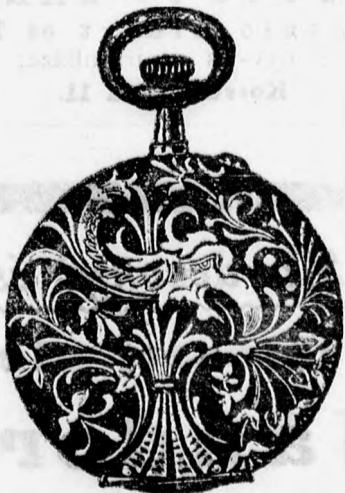
42 szám. acél 5 frt. ezüst 7 frt. arany 30 frt.