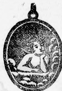
151 sz. double 4 frt. kisebb 1 frt. 50, arany 8 frt kisebb 3 frt.