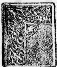
4103 szám Ezüst 15 frt. chna ezüst 5 frt.