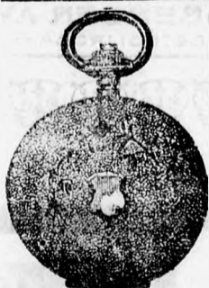
1 szám. Ezüst 6 frt 50. 14 kar. arany 18 frt.