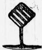
4114 sz. legújabb double gomb párja 2 frt. arany 11 frt.