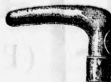
4199 ezüst ébenfa, v. borsfával 6 frt.

szébbnél szébb újdonságok állandóan raktáron.