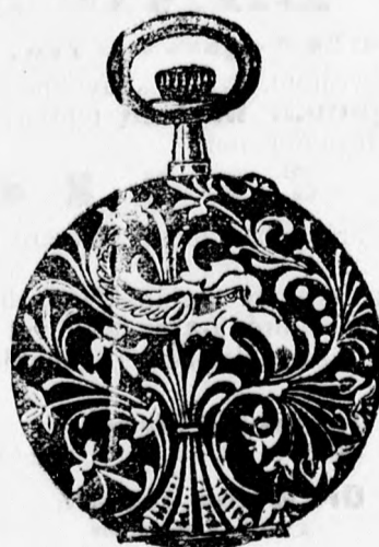
42 szám. acél 5 frt. ezüst 7 frt arany 30 frt.