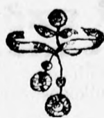
4058 szám. Arany opál türk- kis v. gyöngyvel 4 frt. 50, gyé- mánt 25 frt. brilliárt 100 frt