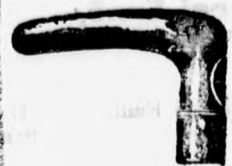
4199 ezüst ébenfa, v. borsfával 6 frt.