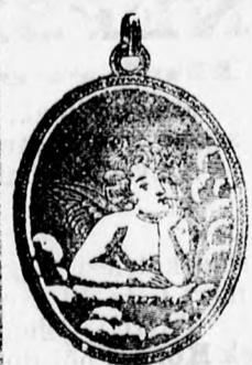
151 sz. doublé 4 frt. kisebb 1 frt. 50, arany 8 frt. kisebb 3 frt.