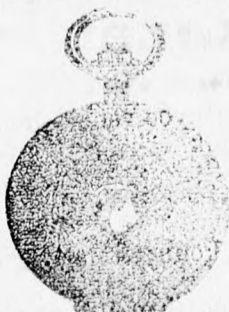
1 szám. Ezüst 6 frt 50 14 kar. arany 18 frt.