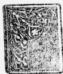
4103szám Ezüst 15 frt chna ezüst 5 frt.