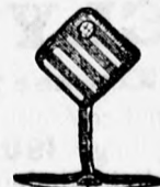
4114 sz. legu- jabb doublé gomb párja 2 frt. arany 11 frt